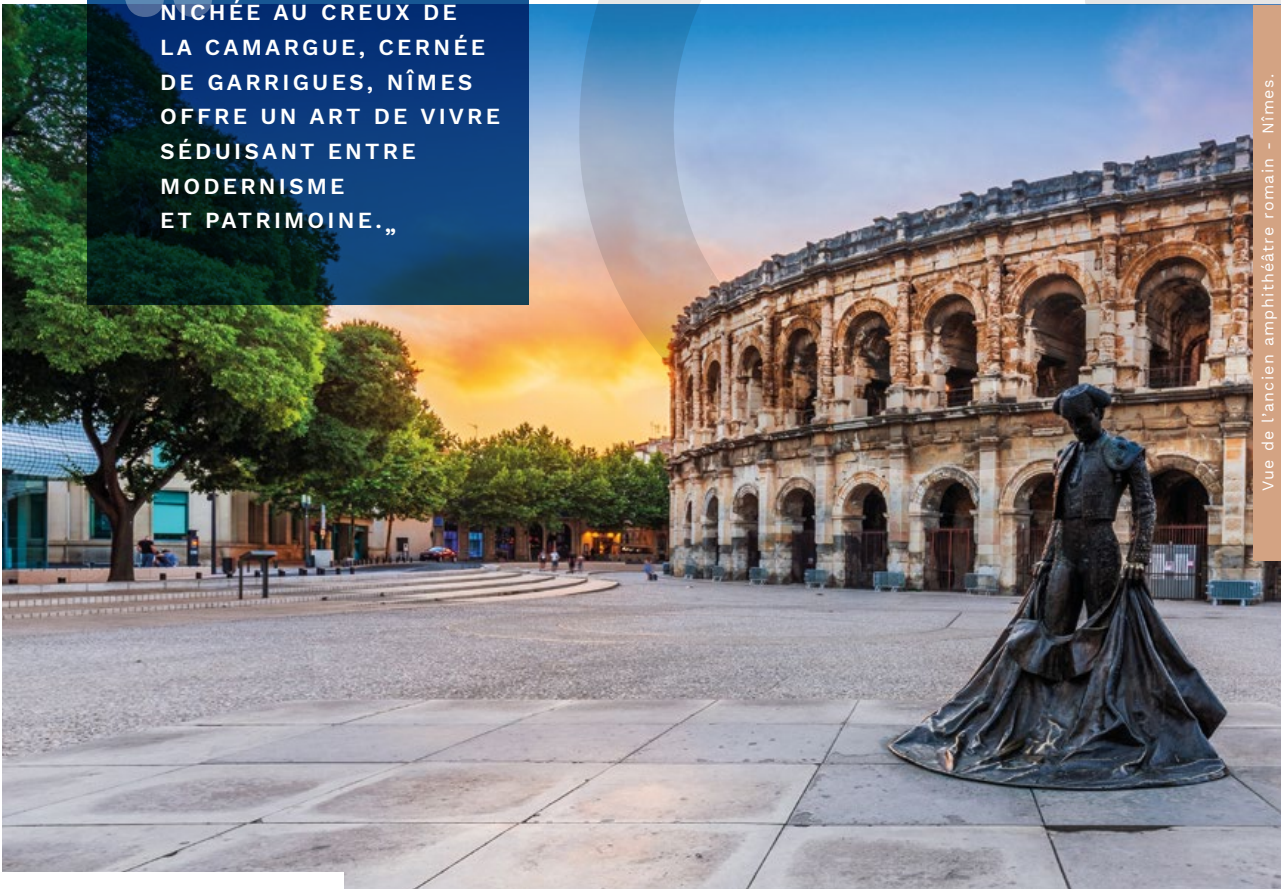
Vue de l'ancien amphithéâtre romain - Nîmes.

CITADINE ET RUSTIQUE, NICHÉE AU CREUX DE LA CAMARGUE, CERNÉE DE GARRIGUES, NÎMES OFFRE UN ART DE VIVRE SÉDUISANT ENTRE MODERNISME ET PATRIMOINE.,,