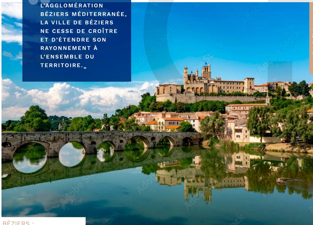
Vue de Béziers

“MÉTROPOLE DE L'AGGLOMÉRATION BÉZIERS MÉDITERRANÉE, LA VILLE DE BÉZIERS NE CESSE DE CROÎTRE ET D'ÉTENDRE SON RAYONNEMENT À L'ENSEMBLE DU TERRITOIRE.”